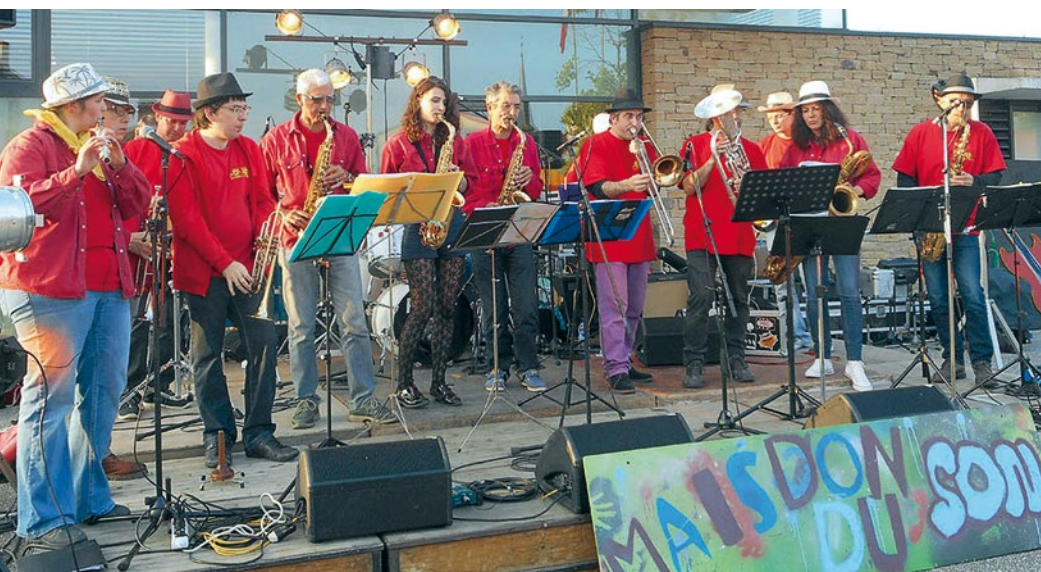
4 Cancelli Musique pendant la «Folle journée de Nantes» 5 Concert des Chapalleros lors du festival «Montmartre à Clisson».