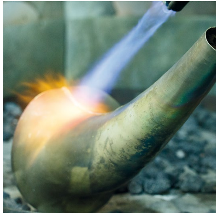
3 Préparation à la soudure du pavillon du saxophone 4 Soudure du pavillon du saxophone 5 Gravure exécutée manuellement sur chaque saxophone

Malheureusement la famille Selmer ne pouvait plus se permettre d'avancer seule car les coûts à engager étaient trop élevés. C'est pourquoi nous nous sommes tournés vers un partenaire investisseur, le fond de capital-investissement Argos Sodic, qui a l'habitude de travailler dans ce genre de contexte et d'aider les entreprises financièrement sans les empêcher de se développer. C'était la meilleure solution.