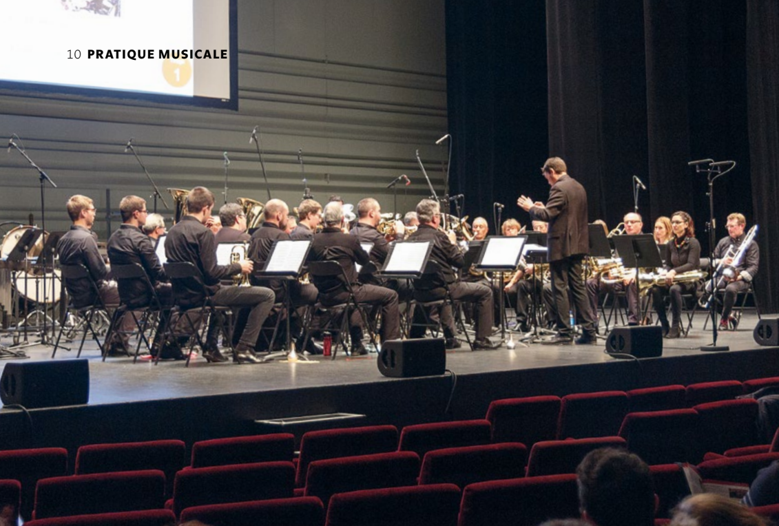
5 Le Brass Band du Pays Bourguellois pendant du Championnat National de Brass Band

originales à des arrangements de musique classique, de film et de variété.