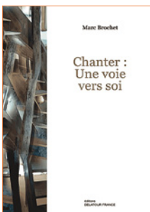
Chanter : Une voie vers soi de Marc Brochet Éditions Delatour France Prix : 15 €