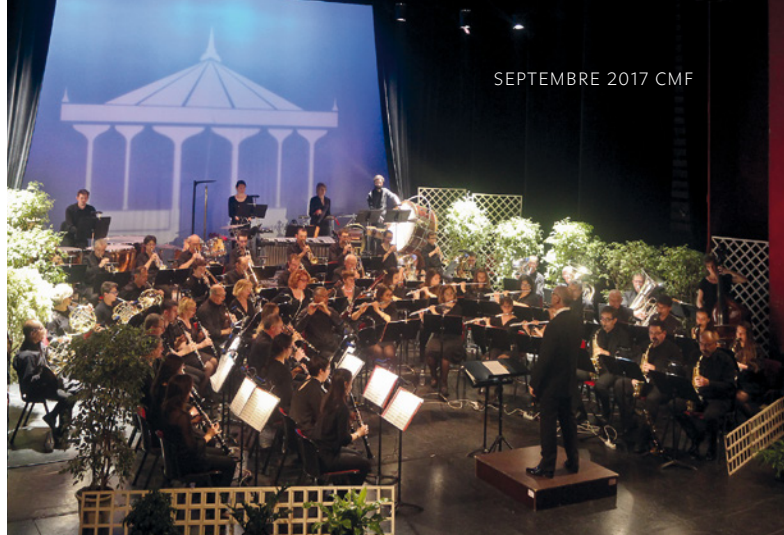
2 Concert des chœurs du Guiers 3 Concert de l'Harmonie d'Aix-les-Bains