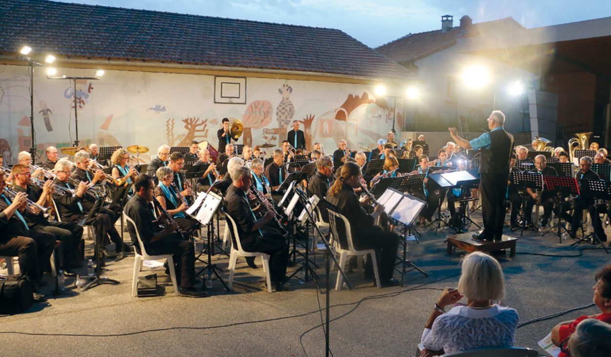
1 Concert anniversaire pour les 180 ans de la Philharmonique de Villelaure