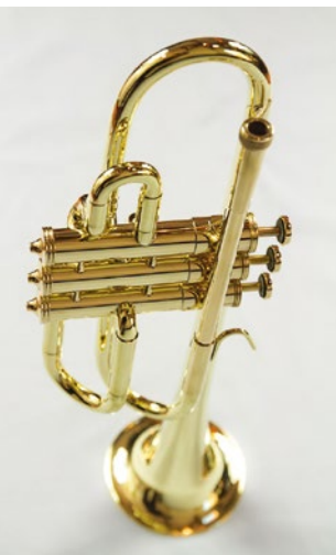
↑ Trompette Sib modèle 9/16